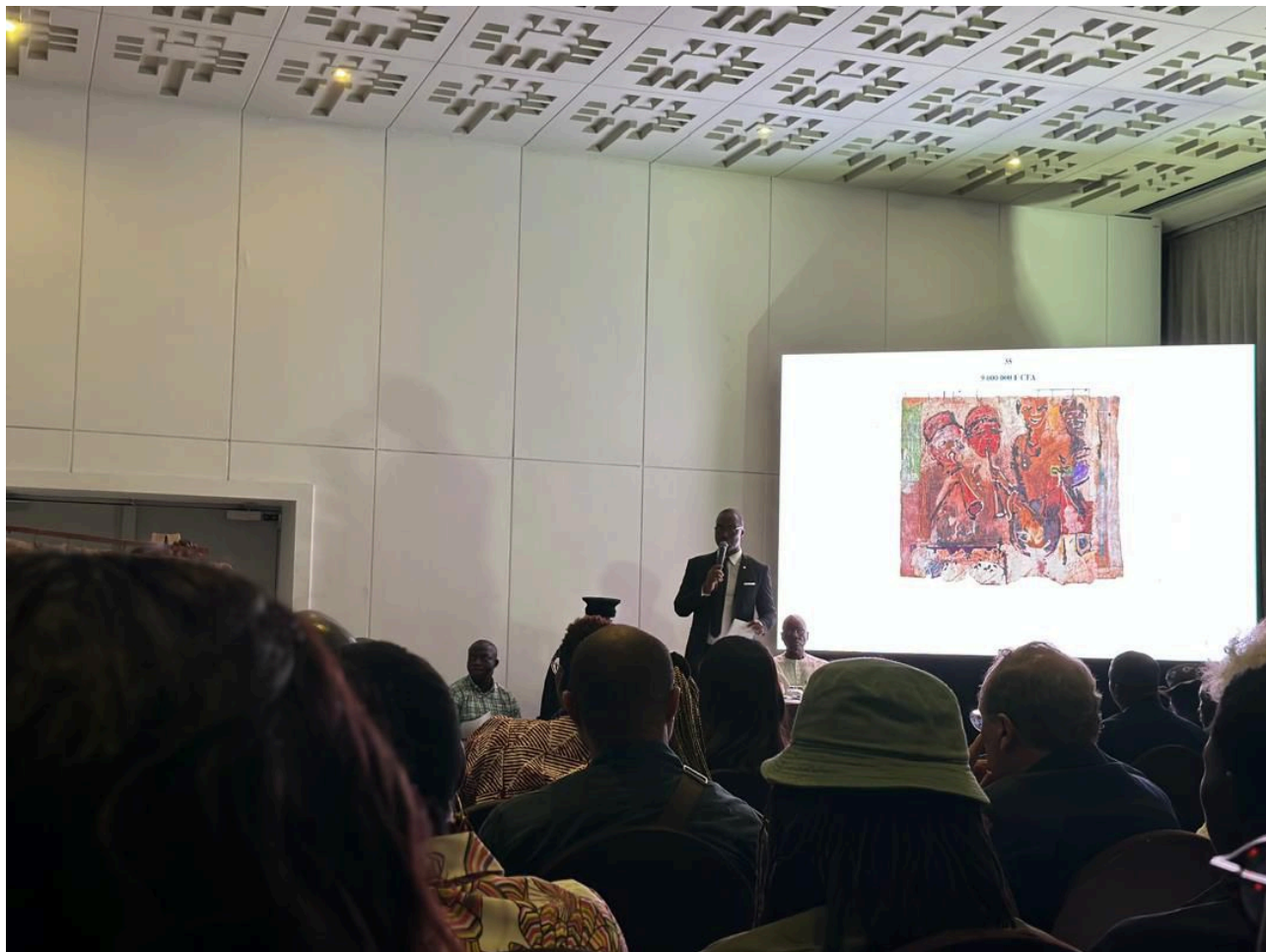
Ph: Vente aux enchères privée d'œuvres d'art africain à Abidjan

Trente-six œuvres d'art de près d'une vingtaine d'artistes africains ont été mis aux enchères le jeudi 30 mai 2024 à Sofitel Abidjan Hôtel Ivoire en présence de collectionneurs et amateurs d'art. Organisée par la maison ABAC, cette toute première vente privée en Côte d'Ivoire vise à mettre en lumière les artistes africains sur la scène internationale mais aussi locale.